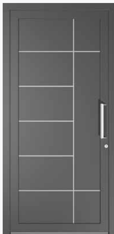
VERONA ALU PPAPVR CA0 | col.35