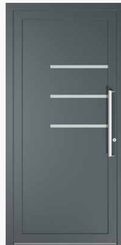
GENOVA ALU PPAPGE CA0 | col.59