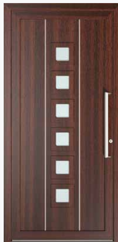
MAIORCA ALU PPAPML LA6 | col.09