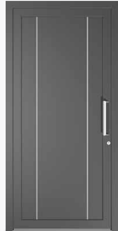
MODENA ALU PPAPMO CA0 | col.35