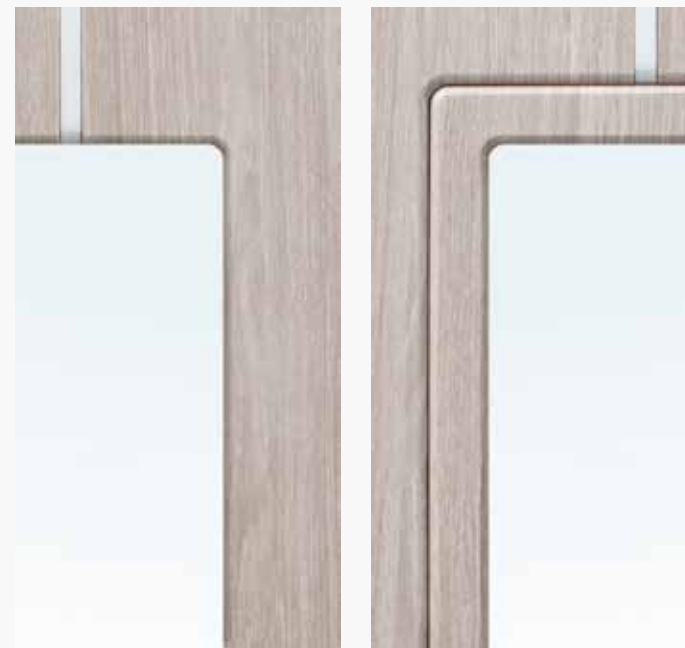
LATO ESTERNO CON INSERTO IN ALLUMINIO