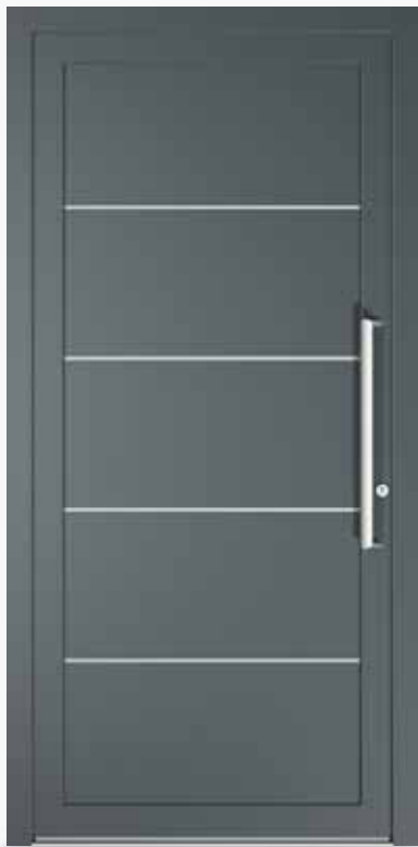
RAVENNA ALU PPAPRA CA0 | col.59