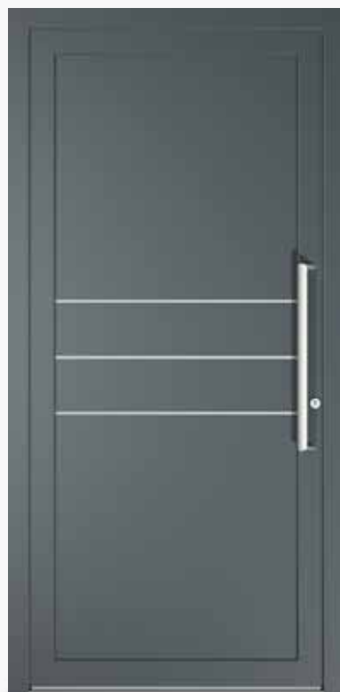
CESENA ALU PPAPCE CA0 | col.59