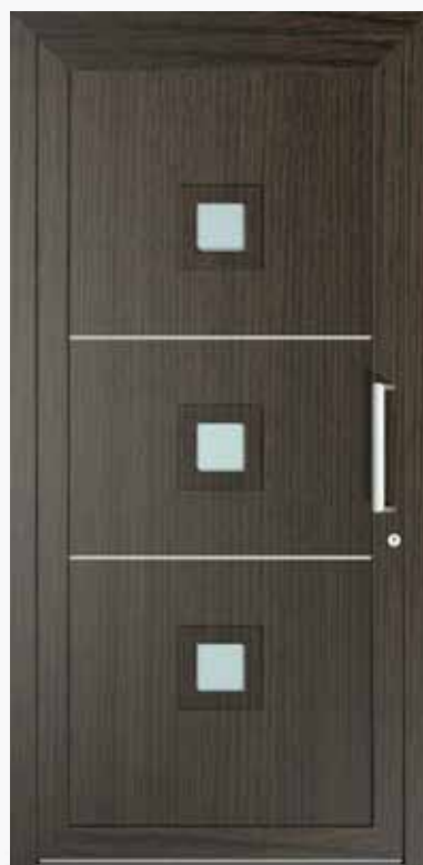
CORINTO ALU PPAPCT LA3 | col.46