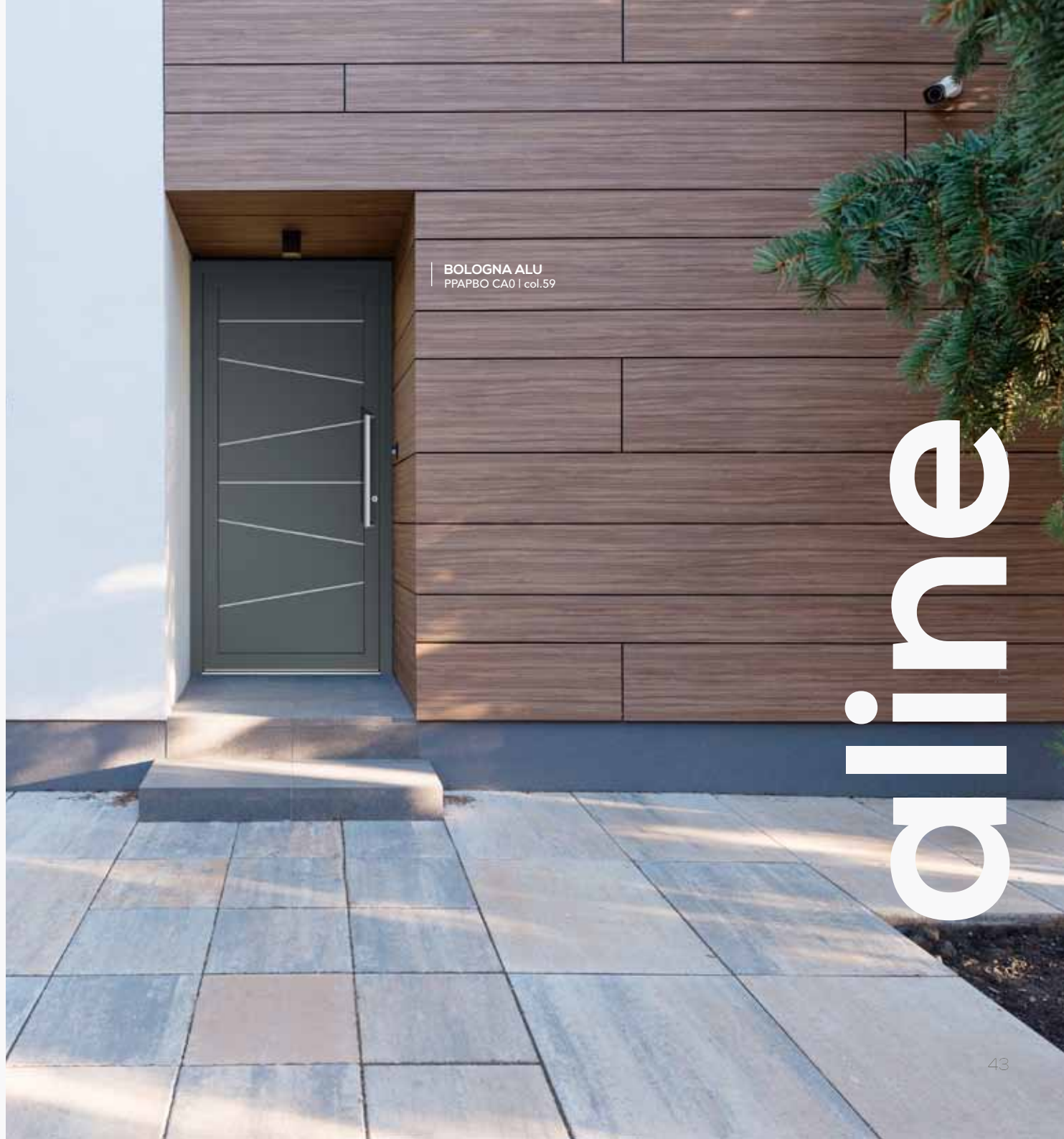
BOLOGNA ALU PPAPBO CA0 | col.59