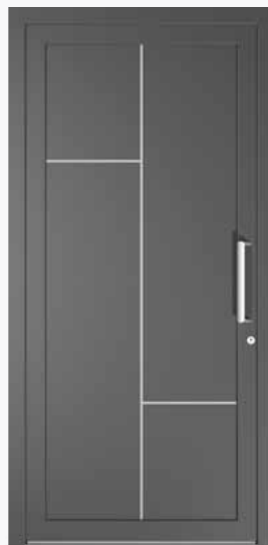
LATINA ALU PPAPLA CA0 | col.35