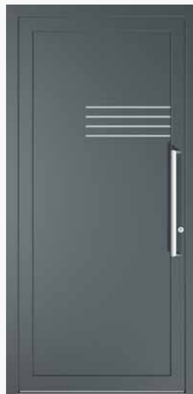
TORINO ALU PPAPTN CA0 | col.59