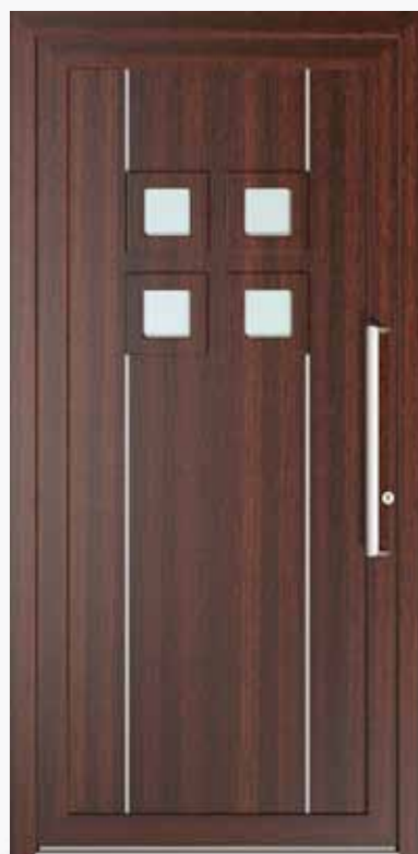
ILLIO ALU PPAPIL LA4 | col.09