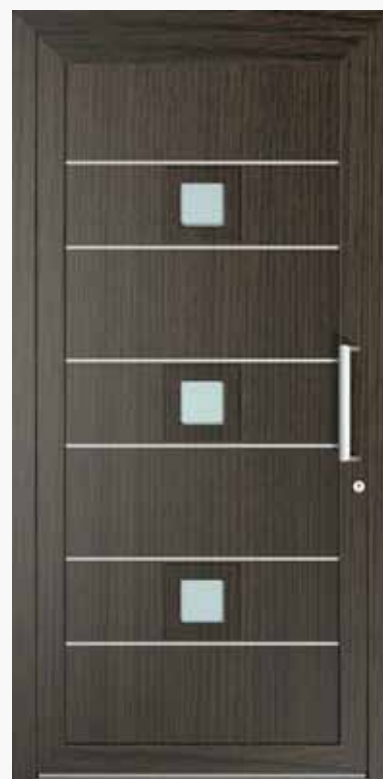
VOLOS ALU PPAPVO LA3 | col.46