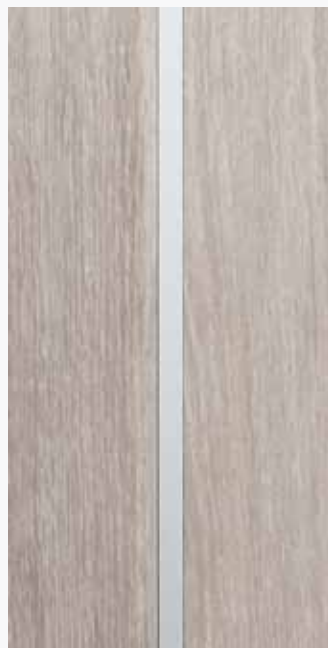
INSERTO IN ALLUMINIO