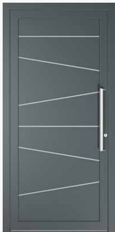
BOLOGNA ALU PPAPBO CA0 | col.59