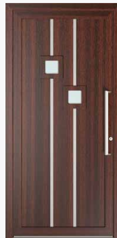
PARENZO ALU PPAPPZ LA2 | col.09