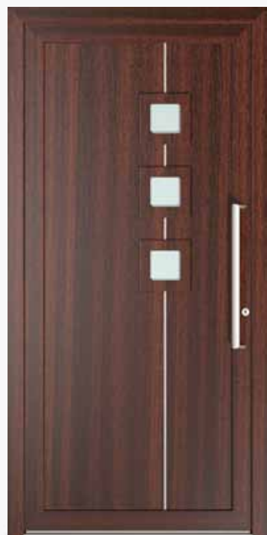
DJERBA ALU PPAPDJ LA3 | col.09