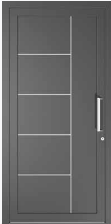
AREZZO ALU PPAPAR CA0 | col.35