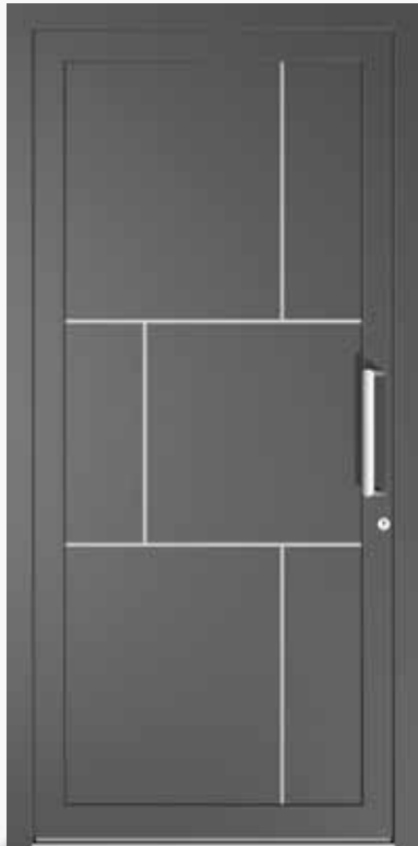
FIRENZE ALU PPAPFI CA0 | col.35