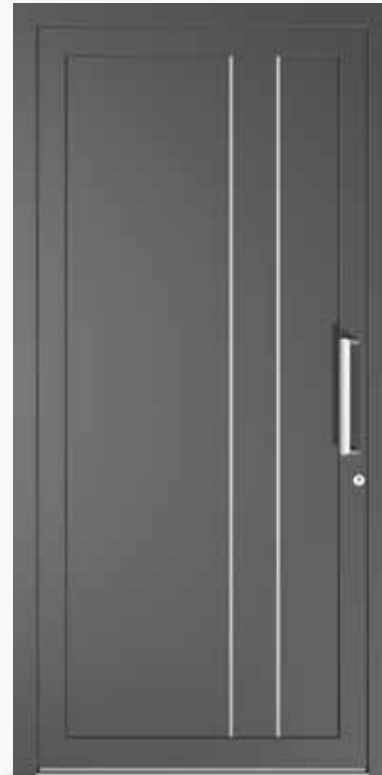
FERRARA ALU PPAPFE CA0 | col.35