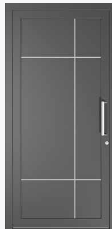
MONZA ALU PPAPMZ CA0 | col.35